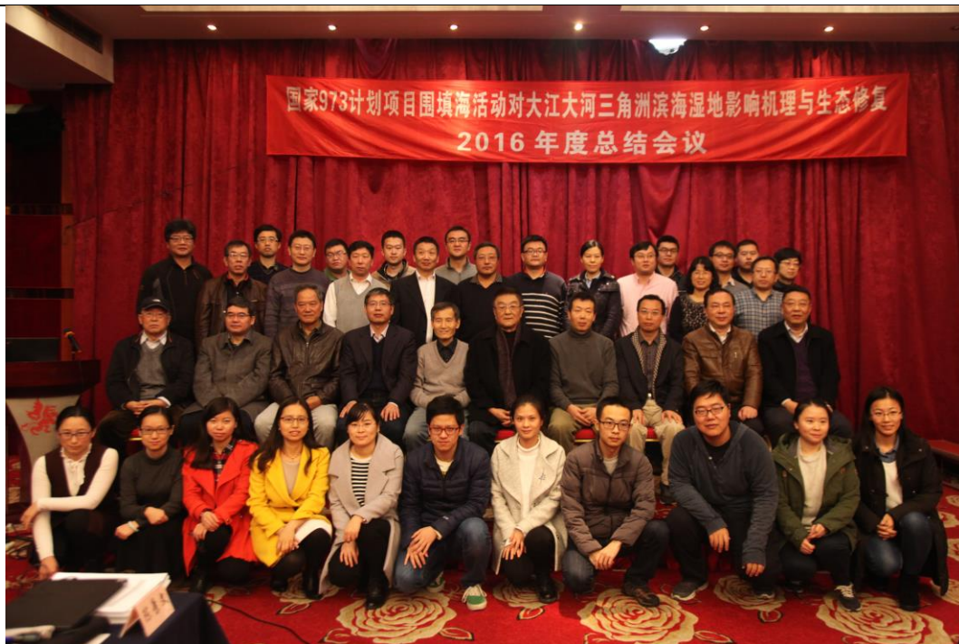
年度总结会议集体留影

会议开幕式上,徐处代表此次会议承办单位对各位专家的到来表示欢迎与感谢,并希望各位专家为各课题研究献策献力,提供指导与帮助。崔保山教授对出席会议的专家和课题研究人员表示了热烈欢迎,并围绕项目的立项与任务分解、组织管理、主要进展、人才培养、合作交流和成果进行了总体介绍。随后各课题进行了课题汇报,分别由课题负责人和课题学术骨干汇报进展。专家组对各课题的年度总结报告进行了仔细审阅,认真听取了课题的汇报,分别从课题研究任务完成情况、与项目任务的衔接以及课题对项目总体目标的支撑方面给予了中肯的建议。专家组建议项目及课题下一步工作要从“收、集、炼”三个方面着手,即课题内部围绕课题任务、目标来收;课题间要有机联系,充分发挥数据共享,相互借鉴;项目层面要围绕一江一河三角洲滨海湿地与围填海的过程及机理上进行凝练,切实回答“能否围、哪里围、如何围”。