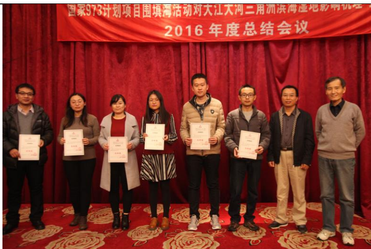
博士研究生论坛颁奖仪式（三等奖）