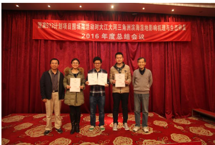
博士研究生论坛颁奖仪式（二等奖）