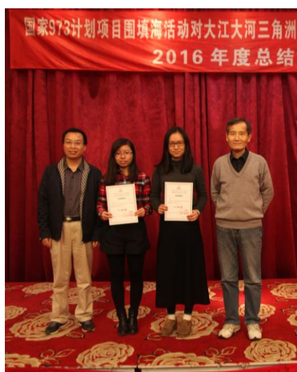
博士研究生论坛颁奖仪式（一等奖）